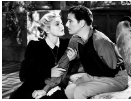
1937 LE PRISONNIER DE ZENDA (The Prisoner of Zenda) de John Cromwell avec Ronald Colman