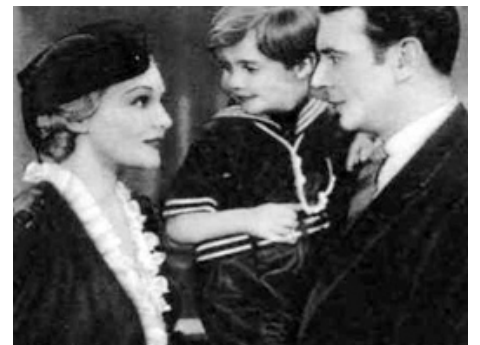
1936 THE CASE AGAINST MRS AMES de William Seiter avec George Brent