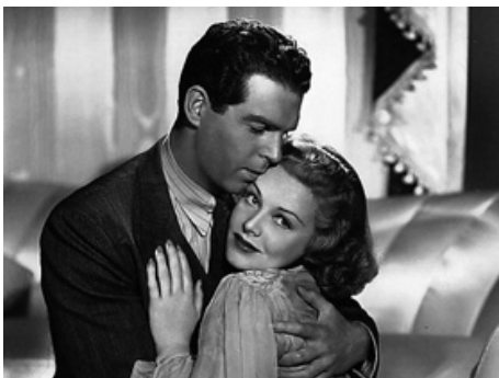
1941 UNE NUIT À LISBONNE (A Night in Lisbon) d'Edward Griffith avec Fred MacMurray