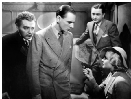
1936 QUATRE DE L'ESPIONNAGE (The Secret Agent) d'A. Hitchcock avec P. Lorre, J. Gielgud, R. Young