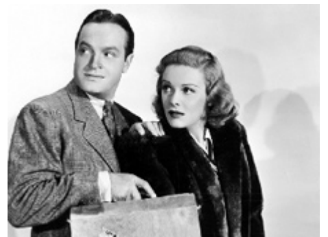
1942 LA BLONDE DE MES RÊVES (My Favorite Blonde) de Sidney Lanfield avec Bob Hope