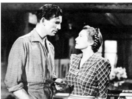
1946 WHITE CRADLE INN / HIGH FURY de Harold French avec Michael Rennie