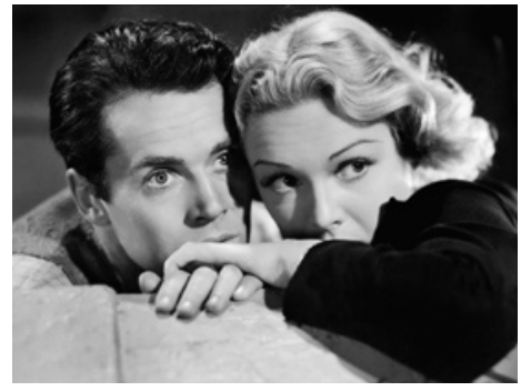
1938 BLOCUS (Blockade) de William Dieterle avec Henry Fonda