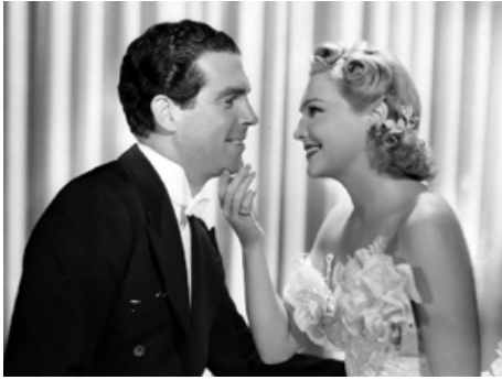
1939 CAFÉ SOCIÉTÉ (Cafe Society) de Edward Griffith avec Fred MacMurray