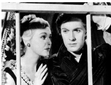
1936 LE PACTE (Lloyd's of London) de Henry King avec Tyrone Power