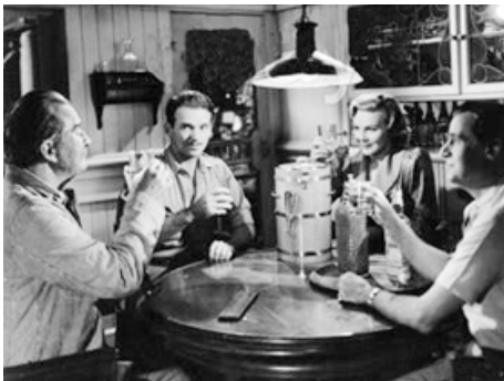
1940 SAFARI (Safari) d'Edward Griffith avec Douglas Fairbanks Jr