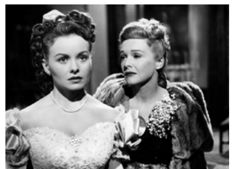
1949 L'ÉVENTAIL DE LADY WINDERMERE (The Fan) d'Otto Preminger avec Jeanne Crain