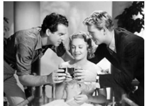
1941 VIRGINIE (Virginia) d'Edward Griffith avec Fred MacMurray, Sterling Hayden