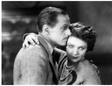
1929 LE BILLET DECHIRÉ (The Crooked Billet) d'Adrian Brunel avec Miles Mander