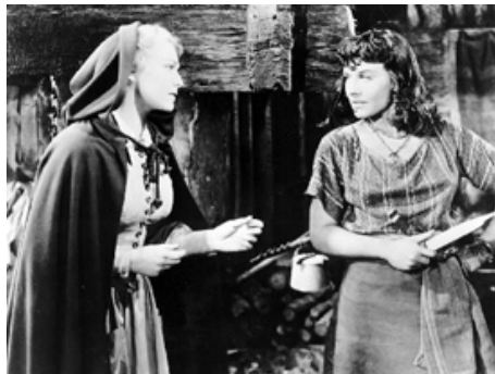
1940 LES TUNIQUES ÉCARLATES (North West Mounted Police) de Cecil B. De Mille avec Gary Cooper