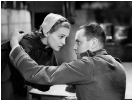
1933 J'ÉTAIS UNE ESPIONNE (I was a Spy) de Victor Saville avec Herbert Marshall