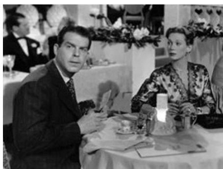
1948 UNE INNOCENTE AFFAIRE (An Innocent Affair) de Lloyd Bacon avec Fred MacMurray