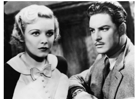
1935 LES TRENTE-NEUF MARCHES (The 39 Steps) d'Alfred Hitchcock avec Robert Donat