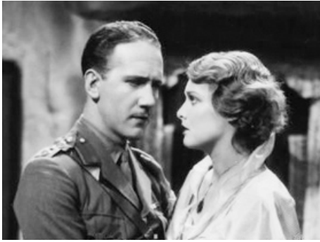
1930 FRENCH LEAVE de Jack Raymond avec Haddon Mason