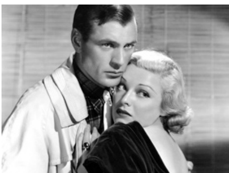
1936 LE GÉNÉRAL EST MORT À L'AUBE (The General died at dawn) de Lewis Milestone avec Gary Cooper