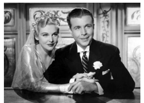
1937 ON THE AVENUE de Roy del Ruth avec Dick Powell