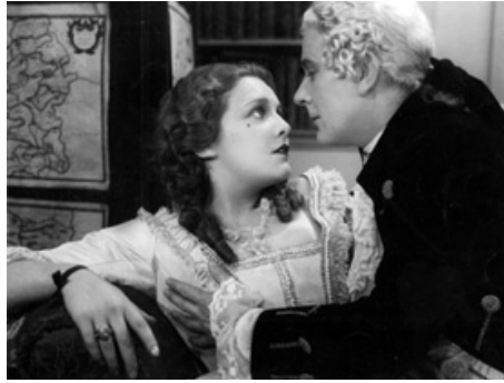
1930 L'ÉCOLE DE LA MÉDISANCE (School for Scandal) de Maurice Elvey avec Basil Gill