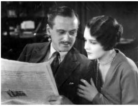
1928 THE FIRST BORN de Miles Mander avec John Loder