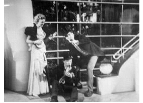
1933 VOITURE-COUCHETTE (Sleeping Car) d'Anatole Litvak avec Ivor Novello