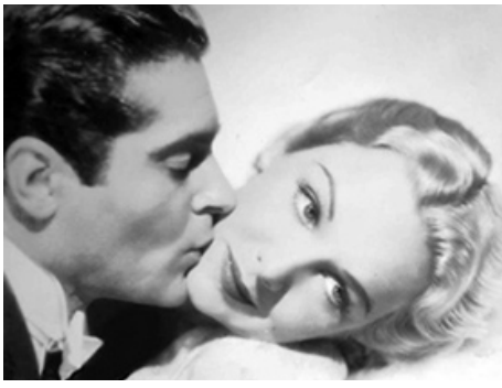
1937 TOUT POUR TOI (It's all yours) d'Elliott Nugent avec Francis Lederer