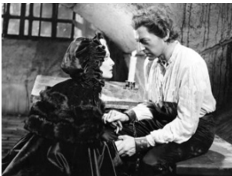
1935 LE DICTATEUR (The Dictator) de Victor Saville avec Clive Brook