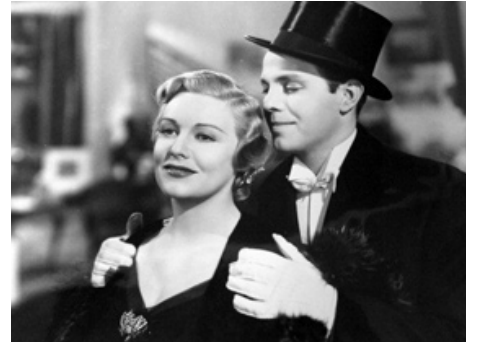
1940 MY SON, MY SON de Charles Vidor avec Louis Hayward